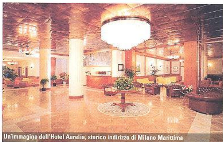
Un'immagine dell'Hotel Aurelia, storico indirizzo di Milano Marittima

stelle Palace Hotel, elegante, curato in ogni dettaglio e dotato di un ampio centro congressi da 500 persone, divisibile in 4 spazi indipendenti e insonorizzati. A seguire il Mare & Pineta, quattro stelle superior, pronto, come abbiamo detto, a