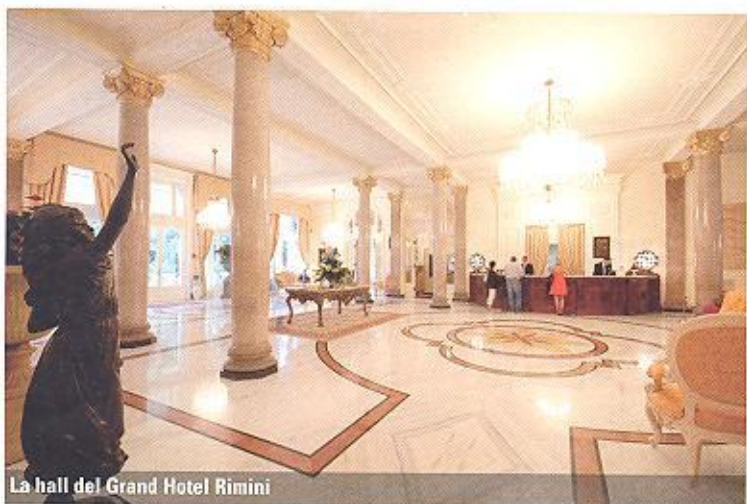
La hall del Grand Hotel Rimini

qualificare ulteriormente la propria offerta, le quattro stelle del Grand Hotel Gallia, dell'Hotel Aurelia, dell'Hotel Doge e le tre dell'Hotel Brasil.