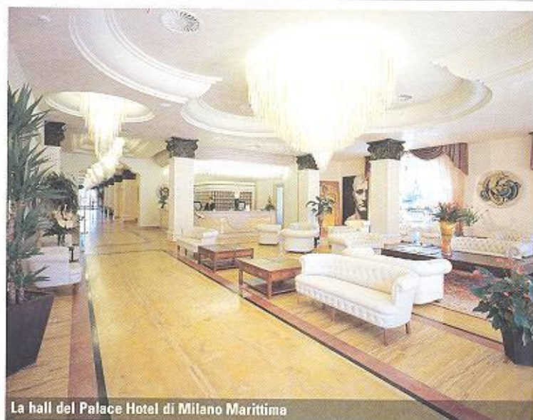
La hall del Palace Hotel di Milano Marittima

qualità prezzo e dal servizio con la S maiuscola. Grand Hotel Rimini a parte non possiamo non fare cenno alla vera e propria cittadella dell'ospitalità che il gruppo ha creato a Milano Marittima. Fiore all'occhiello in questo senso il cinque