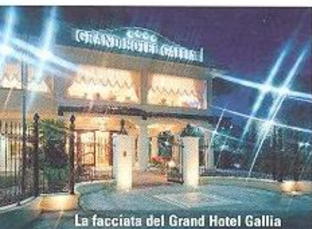
La facciata del Grand Hotel Gallia