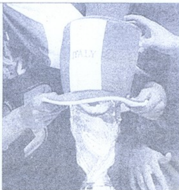
La città dei vip ha fatto goal domenica mattina arriverà la Nazionale al Palace Hotel

Arrivo previsto per domenica mattina, nel pomeriggio l'allenamento al Todoli