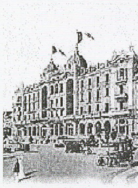
Rimini - Il Grand Hotel 1920

Nel film manifesto del regista de "La dolce vita", le leggende sui frequentatori dell'edificio. Dagli arabi e le loro mogli, fino ai Vitelloni che tiravano tardi tutte le notti tra balli e vino