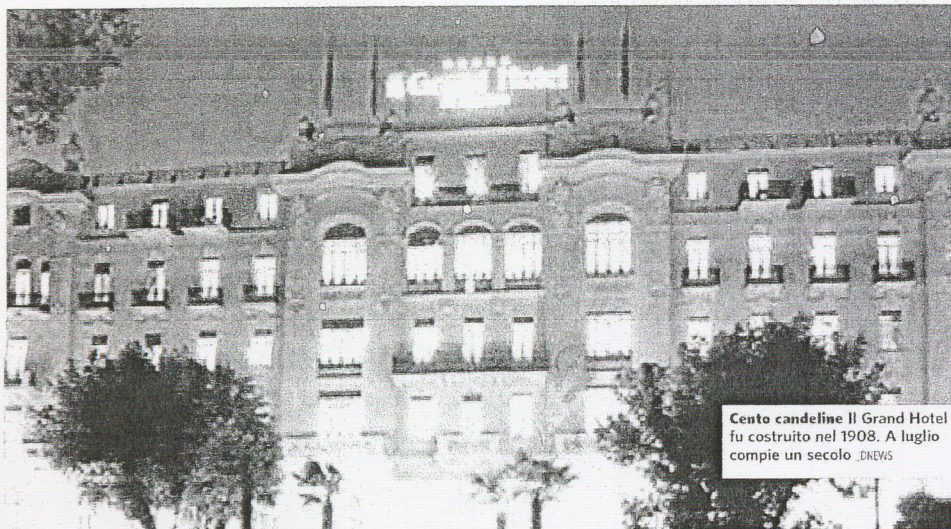
Cento candeline Il Grand Hotel fu costruito nel 1908. A luglio compie un secolo DNEWS