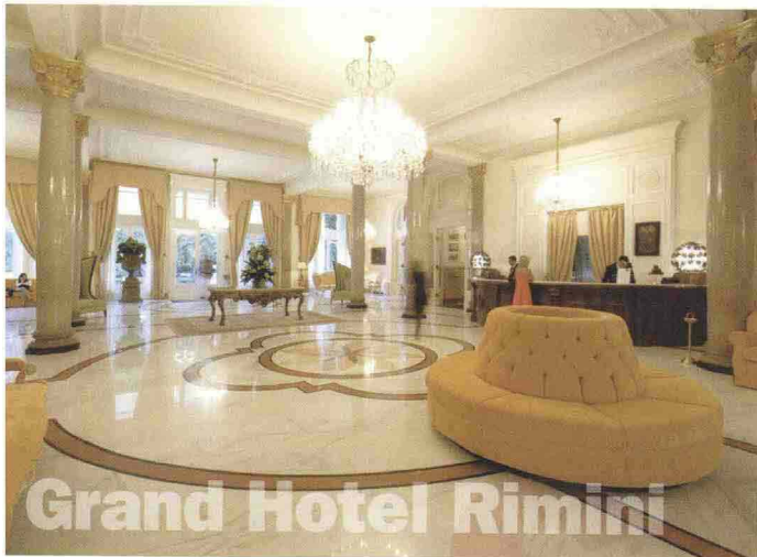
Grand Hotel Rimini