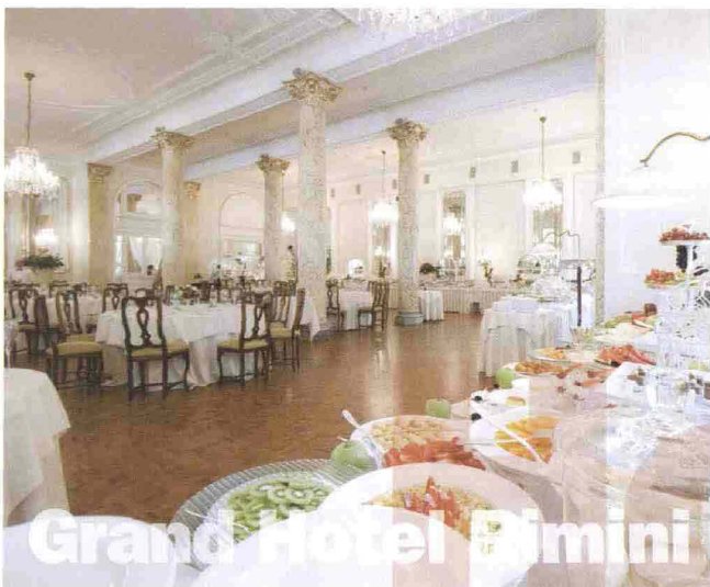
Grand Hotel Rimini